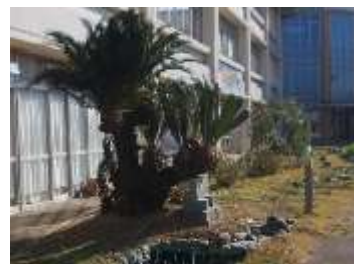
すっきり美しくなった ソテツと学級園

「子どもたちが気持ちよく学校生活を過ごせるように」と、今年も11月7日（土）に守山市シルバー人材センター玉津支部の皆様が、校舎周辺の環境整備をしてくださいました。生い茂ったソテツや学級園周辺、校舎の裏手など愛校活動や日ごろの清掃では行き届いていないところの剪定や除草作業をくださり、見違えるほど美しくなりました。ありがとうございました。