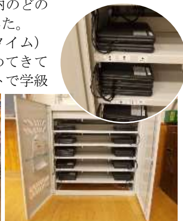
各教室の充電保管庫に 1人1台のPCを収納