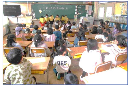
新1年生入学説明会での1年生

1月20日に「 大寒(だいかん) 」を迎えました。二十四節気の大寒は、「1年で最も寒さが厳しい時期」という意味です。2025年は1月20日から2月2日までの期間です。寒さが続く中、疲れもたまっていく頃です。今年は、インフルエンザやおなか痛くなる風邪が流行しています。手洗い、うがい等予防をしっかりと、体調管理に心掛けましょう。そして、大寒の最終日は、豆まきでおなじみの「 節分(せつぶん) 」です。今年2月2日が節分です。節分の翌日は「 立春(りっしゅん) 」で、暦の上では春になります。3月には70人の6年生が小津小学校から巣立ちます。6年生は、心身ともに中学生になる準備が整い、落ち着いた学校生活を送っています。6年生の背中を見てきた5年生が、小津小学校の原動力として活躍し始めています。1月の「おづっこ集会」や「おづっこタイム」では、見事な采配で「新しい小津小の歴史を作ろう！」と意気込む姿を見せてくれました。また、4月には、新1年生が入学してきます。1月31日の「新1年生入学説明会」では、「新しい1年生に小学校のことを知ってもらおう」と1年生が自分たちで考えて一生懸命発表をしました。新1年生から見ると、憧れの小津小学校です。どんな楽しいことが待っているのだろうとワクワクする反面、新しい環境にうまくなじめるかなあと不安を抱えている園児もいるでしょう。新1年生たちが安心して登校できるように、おづっこ全員で心を一つに合わせて、ますます楽しい小津小学校にしていきたいと思います。