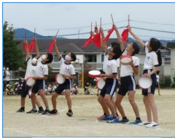
運動会でのエイサー

10月には、規模を縮小しての運動会をはじめ、1年生と2年生の遠足、4年生のやまのこ事前学習、5年生のうみのこ事前学習、6年生の平和学習と様々な体験やゲストティーチャーからの学びを通してたくましさを感じる姿が見られました。また、守山市青少年美術展や各団体の展覧会への出品に向けての作品作りにも意欲的に取り組んでいます。学級担任をしていると、この頃からとても嬉しいことが起こり始めます。それは、子どもたちの自信があちらこちらに連鎖し始めることです。「運動会で活躍できた。」「班活動でリーダーシップを発揮できた。」「一生懸命描いた絵が学級代表に選ばれた。」などがきっかけとなり、「苦手なことに根気強く取り組むようになった。」「積極的に意見を発表するようになった。」など、次の挑戦をする自信につながっていくのです。中には、顔つきまで凛々しく変容する子もいて、子どもたちの可能性は無限大であることに気づきます。