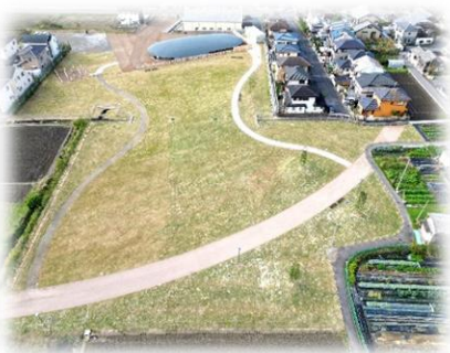
開放感ある芝生広場 遺跡の大きさを体感しよう！