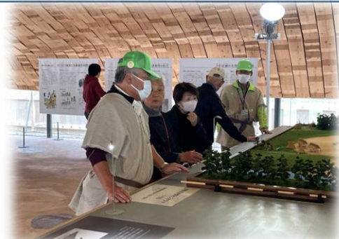
地域の皆様も活躍中！ 伊勢遺跡史跡公園コンシェルジュ