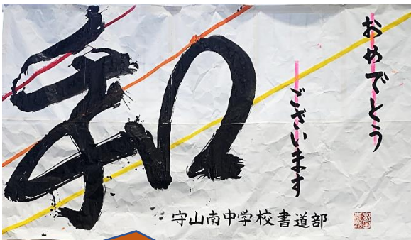
書道部の作品「感謝の気持ちを込めて、大筆で一筆一筆丁寧に書き上げました。」