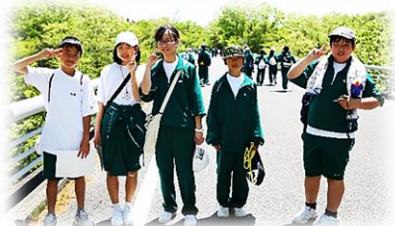
1年生 希望が丘でのオリエンテーション

義務教育最終となる中学校3年間の教育課程を修了し、未来へと旅立つ359名の卒業生の皆さん、ご卒業おめでとうございます。心からお祝いをします。