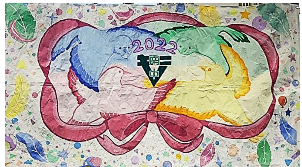
美術部作品「『和』のテーマに合わせて、他の鳥とともに調和しながら成長していく様子を描きました。」