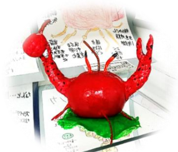
1年生徒立体作品「りんごガニ」