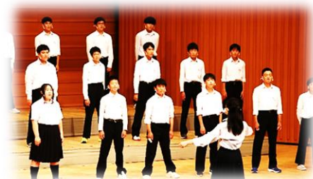
3年生 合唱コンクール

3年生の7月、市民ホールで合唱コンクールが開催できました。ソーシャルディスタンスはたっぷり、でも心と心は密にして、お互いを信じ、すばらしいハーモニーを奏でました。