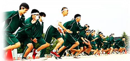
2年生 スポーツフェスティバル

2年生はコロナ禍のため、臨時休校・分散登校でのスタートとなり、9月にリモートでのキラリ☆祭、そして10月に学年開催でしたが、スポーツフェスティバルで力を合わせてのびのびと競技に参加しました。