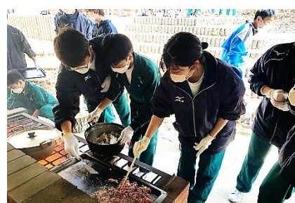
3月11日校外活動(希望が丘)