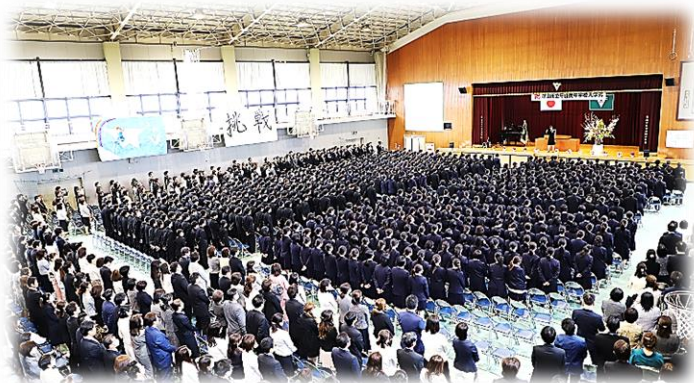
入学式での出会い、守山南中の大きさを実感

義務教育最終となる中学校3年間の教育課程を修了し、未来へと旅立つ359名の卒業生の皆さん、ご卒業おめでとうございます。心からお祝いをします。