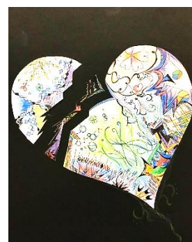
3年生生徒の作品 「今の気持ち」

今なお解決しないさまざまな差別や人権問題、いじめ問題は、一部の人の問題ではありません。知らず知らずのうちに人を傷つけてしまうこと、そして傷つけたことに気づけずにいること、それは誰にも起こりうる事なのです。だからこそ、すべての人が気持ちよくすごせるように今一度考えたいですね。