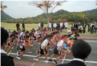
11/15 県駅伝 (女子の部)