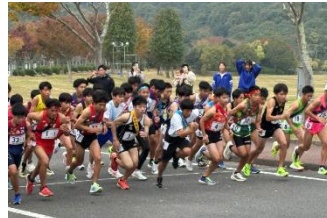
11/15 県駅伝 (男子の部)