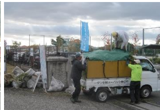
11/16～ シルバーさん草刈り