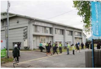
11/1 心と心をつなぐ挨拶運動