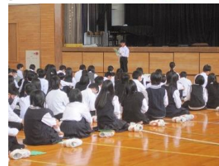
5/29 私の思い学年発表