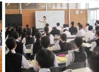
5/30 職場体験マナー講習