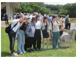
民泊の方と記念撮影