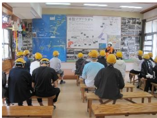
壕（ガマ）見学前の講習