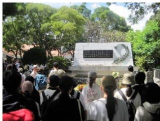
ひめゆりの塔見学